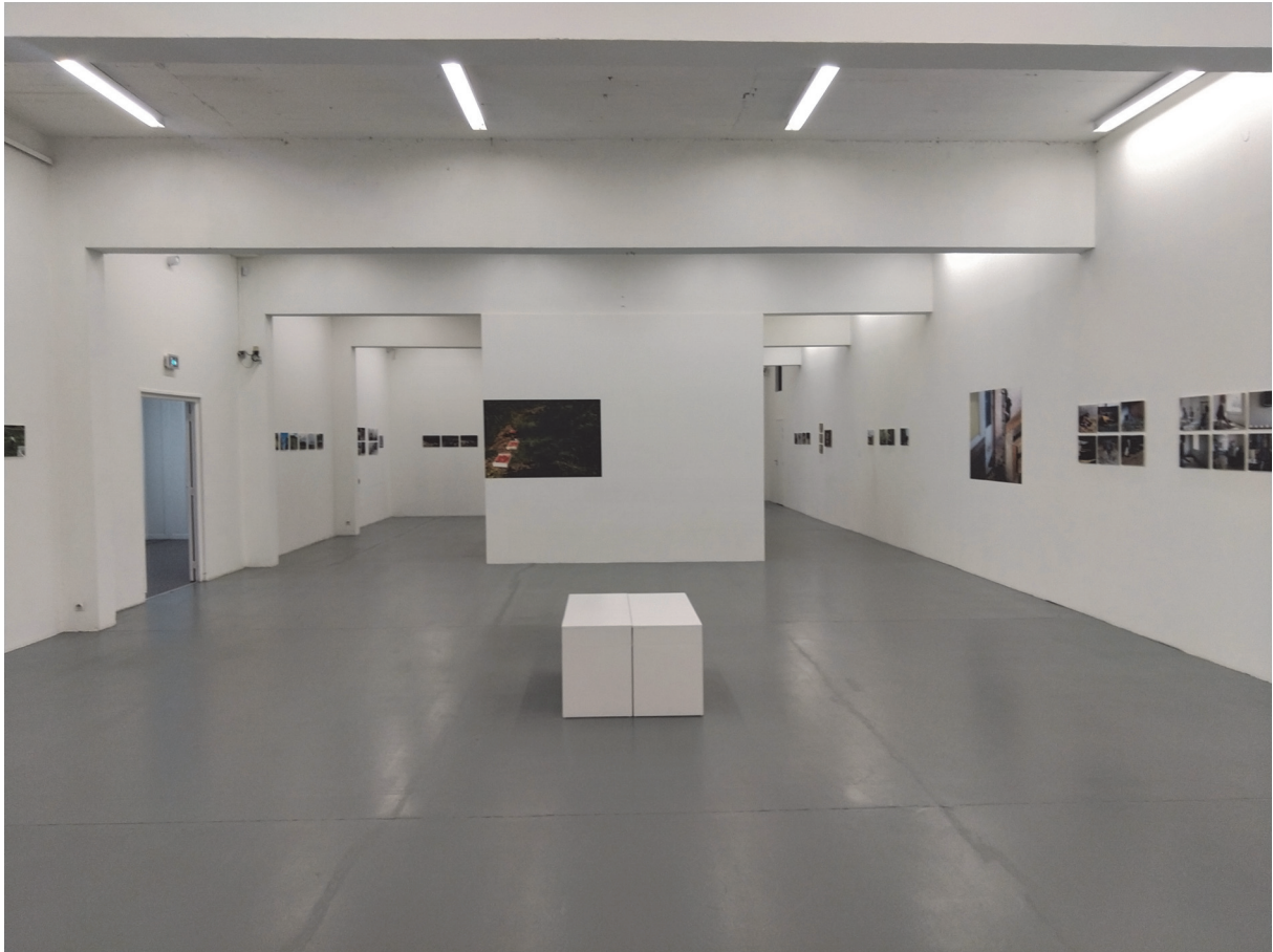
Vue de l'entrée principale (5)