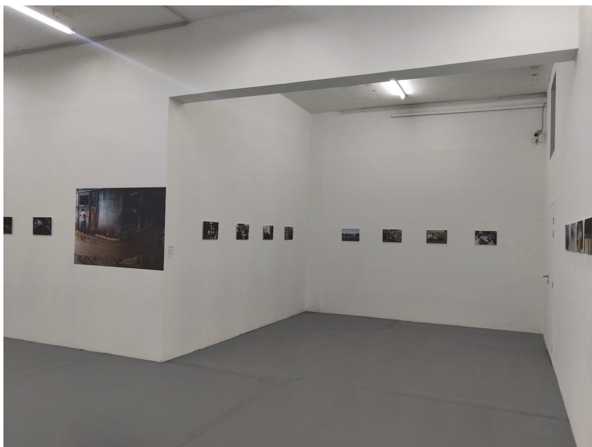
Vue de l'alcôve sur le côté gauche au pied de la cimaise 2/3 (6)