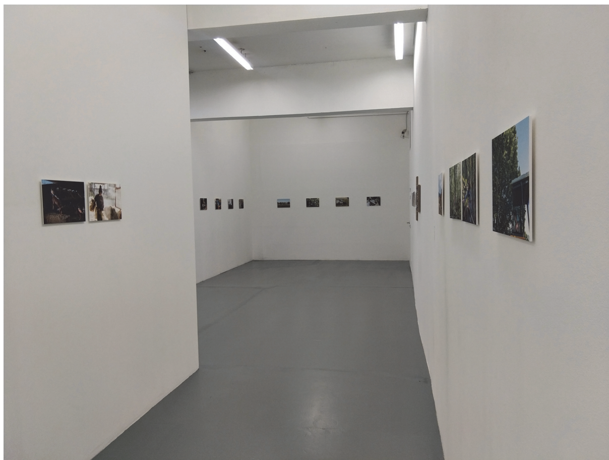
Vue du fond sur le côté droit au pied de la cimaise 2/3 (1)