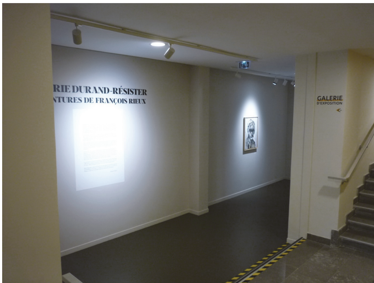
Le mur du titre (généralement)

En arrivant en bas de l'escalier depuis le palier (porte double)