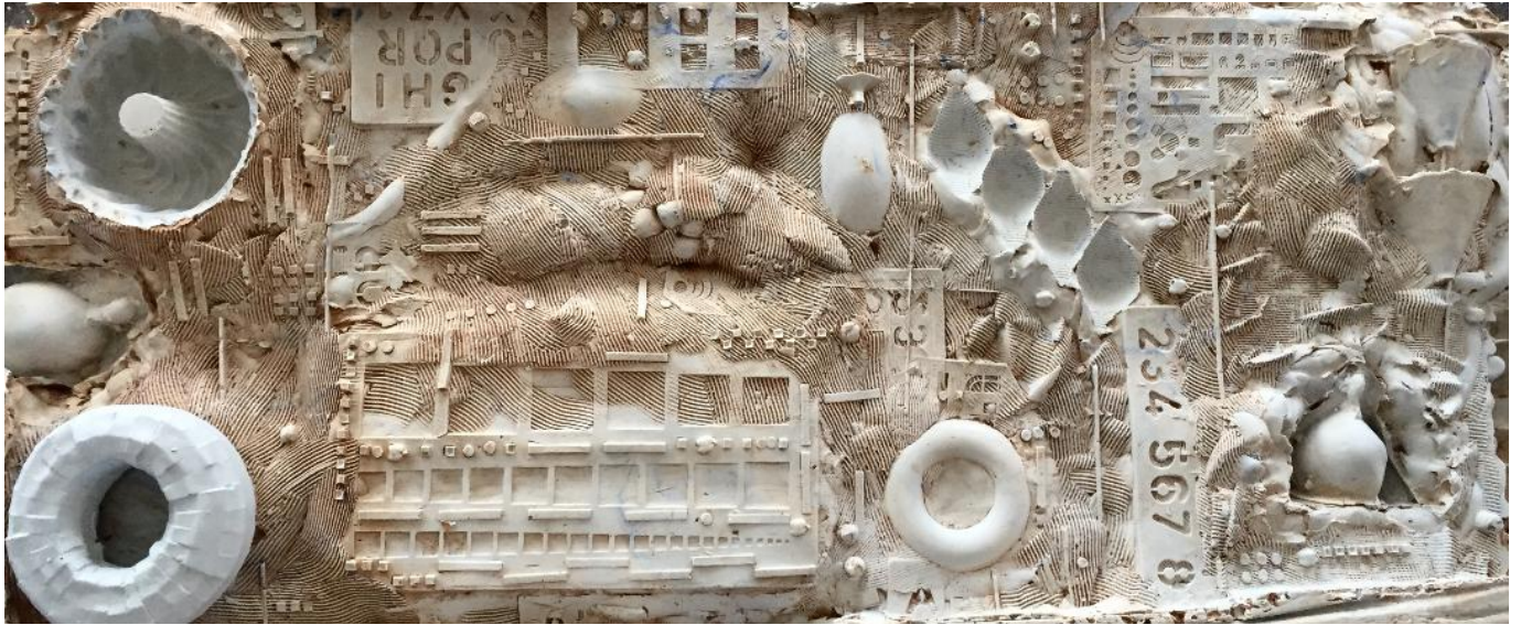
Devant devant , 2018, bas-relief Plâtre, 85 x 36 x 12 cm © Artiste