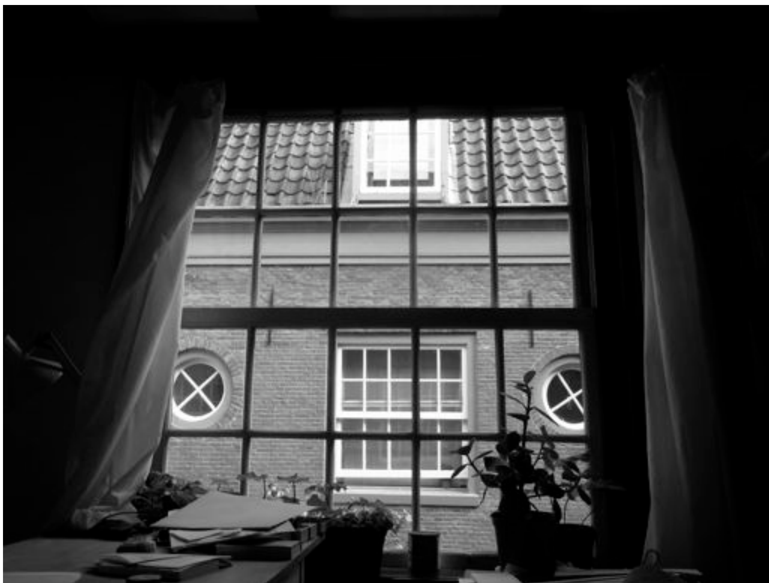
Lei Saito 46I Egelantiersstraat (2013) lithographie, 57x71cm

Vue du salon d'un couple à Amsterdam. Regards croisés dans une image à trois directions, qui joue avec le mouvement horizontal du rideau et la verticalité de la fenêtre à guillotine. Dans l'épaisseur imperceptible de la lithographie se trouve une profondeur, un temps où l'intimité est cristallisée. Le spectateur a le point de vue de l'occupant du salon, dans un espace situé à la limite entre privé et public.