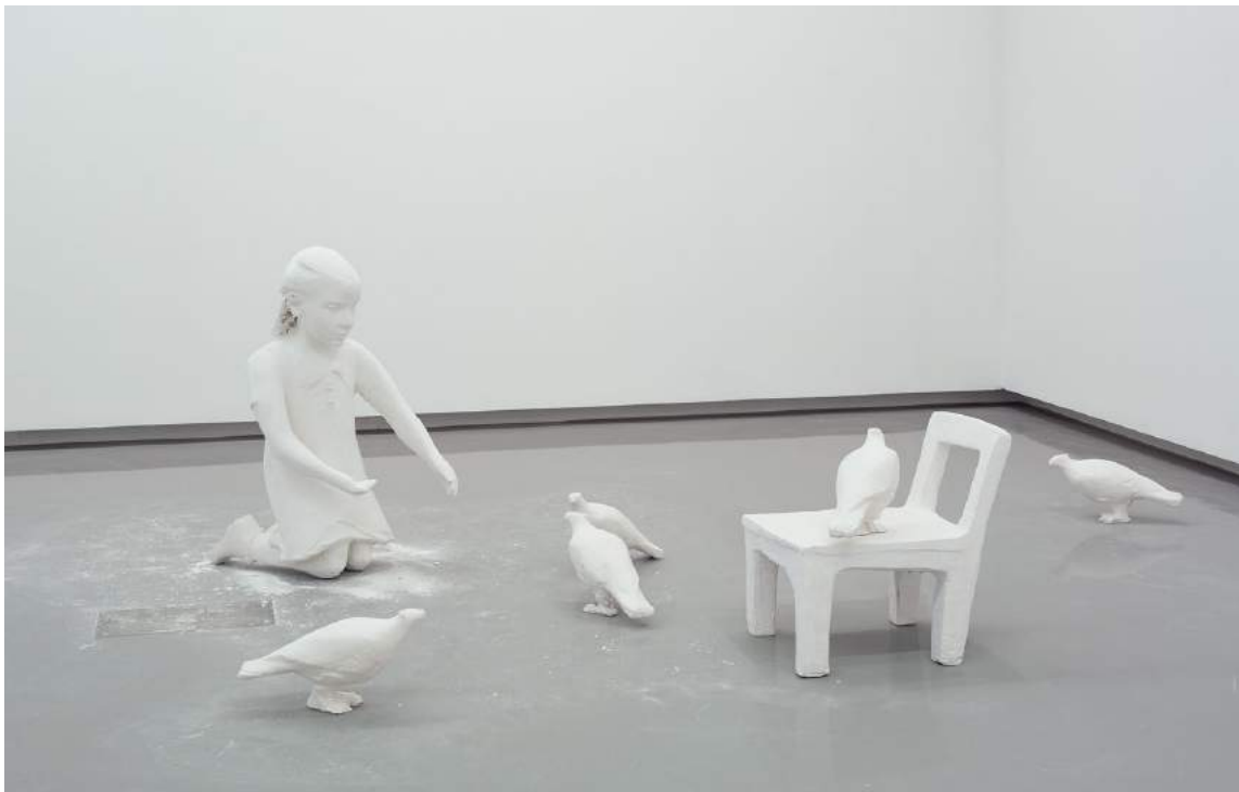
Dominik Lang, Vue de l'exposition Girl with Pigeon , MUMA, 2015, courtesy hunt kastner, Prague.