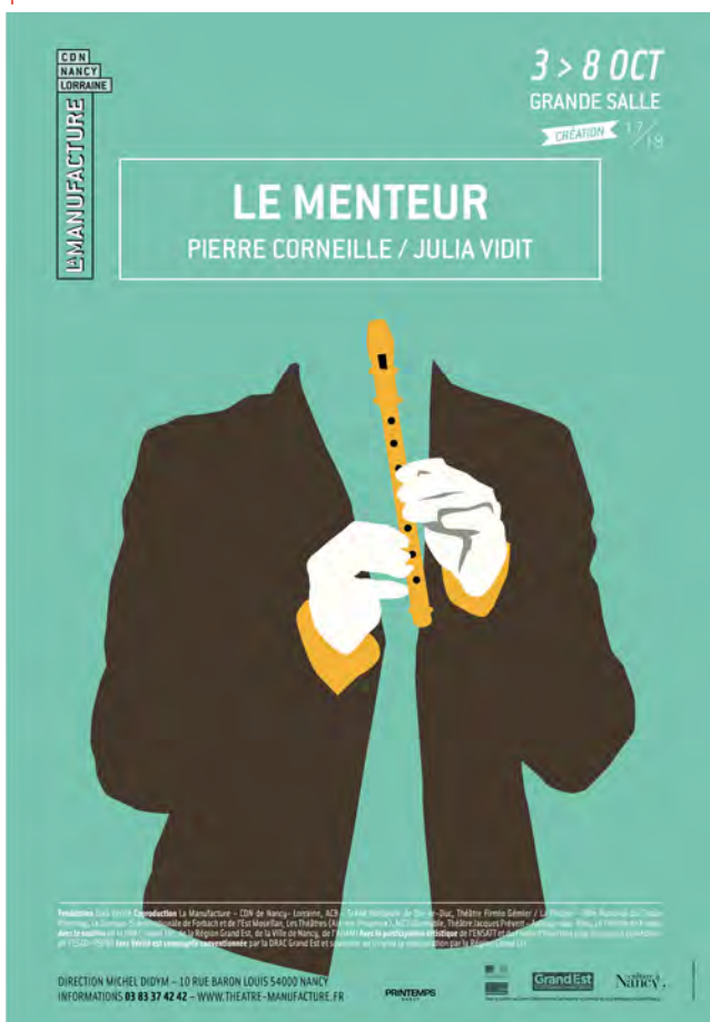
1: Affiche de la création Le menteur © CDN Nancy Lorraine – La Manufacture