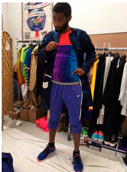
1, 2 et 3 : Essayage des costumes de Lucrèce, Clarice, Isabelle, Cliton et Philiste