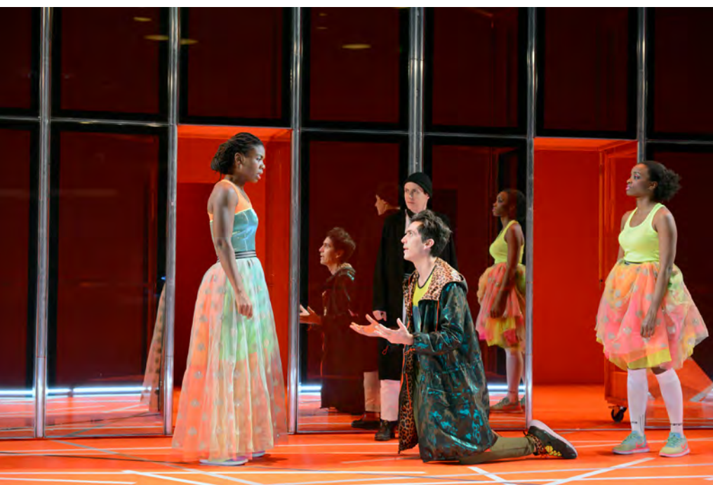
Dorante rattrapé par ses mensonges

Sur scène, demander à une dizaine d'élèves de marcher de façon naturelle mais en se concentrant sur leur téléphone en main, sans prendre conscience de ce qui les entoure. Au top, ils s'arrêtent et prennent une pose comme pour faire un selfie, en choisissant un angle particulier ou une position comique. Faire réfléchir ensuite les élèves au « tableau ainsi formé », en analysant les propositions de chacun.