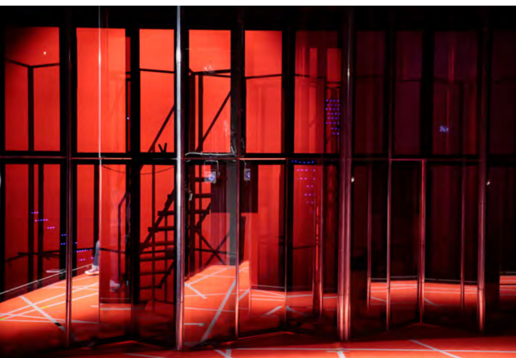
Le décor et ses jeux de miroirs

L'intérêt du miroir sur scène est qu'il permet une représentation multiple des personnages : les miroirs agissent comme une véritable mise en abyme ; ils révèlent la dualité, la multiplicité, l'importance de l'apparence.