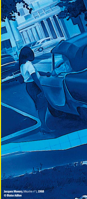
Jacques Monory, Meurtre n°1 , 1968

Ad Libitum, salon de curiosités Rue de la République PRIVAS