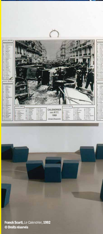
Franck Scurti, Le Calendrier , 1992