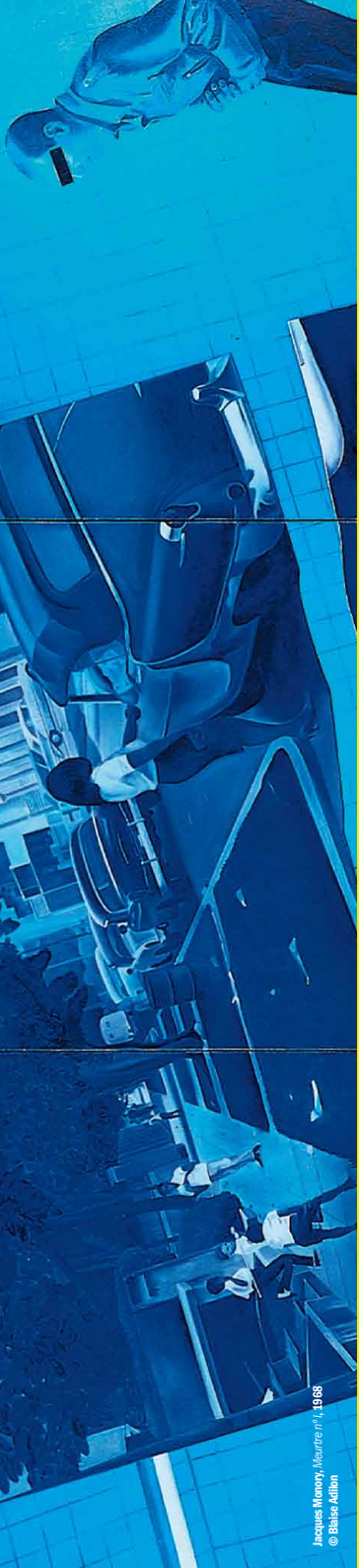
Jacques Monory, Maître n°1 , 1968 © Billaud Adhon