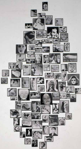
Annette Messager, Les Tortures volontaires . Album-collection n° 18, 1972